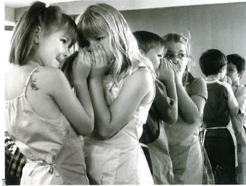
Mynd fra alnótini

Hvad plejer man at gøre, hvis nogen har det dårligt?