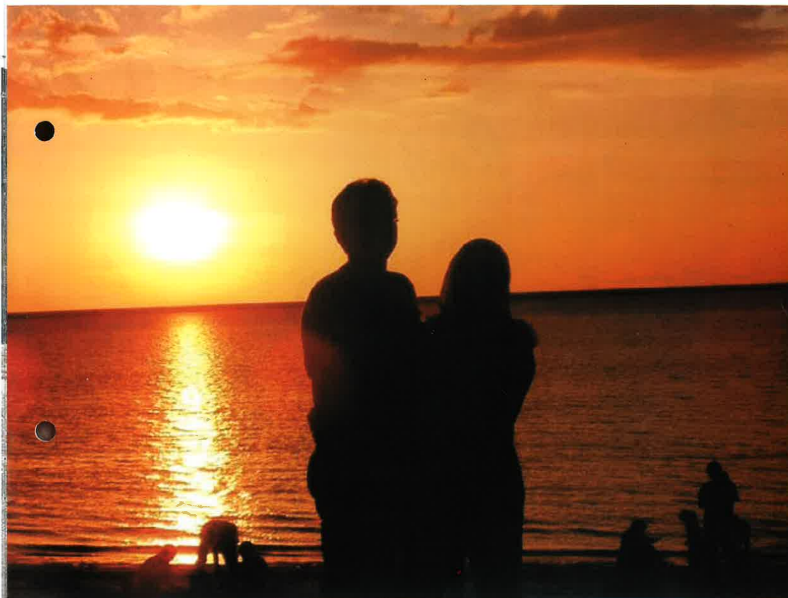
Mynd fra alnótini

Musik: Anne Linnet (1989) Anne Linnet (født 30. juli 1953 i Åbyhøj) er en dansk komponist og sanger.