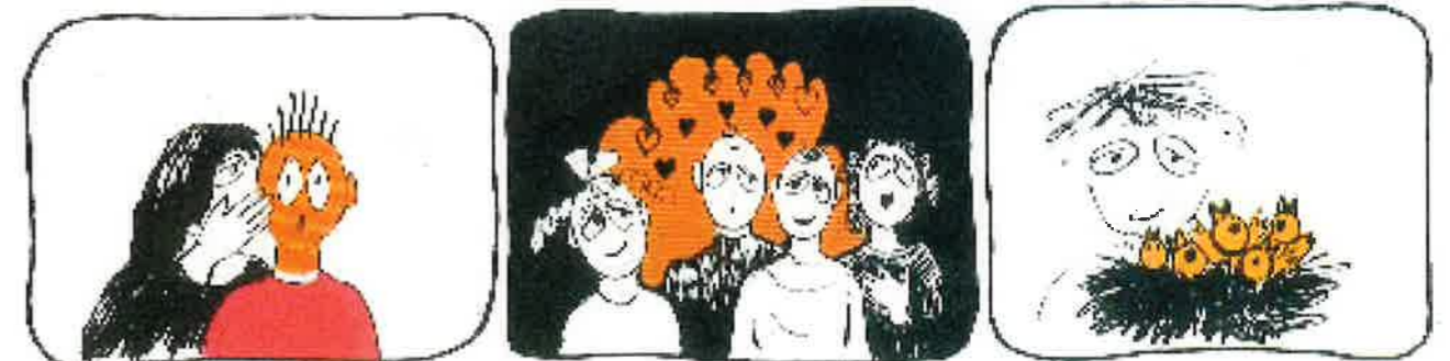
Myndir úr arbeiðsheftinum "Min krop er min".