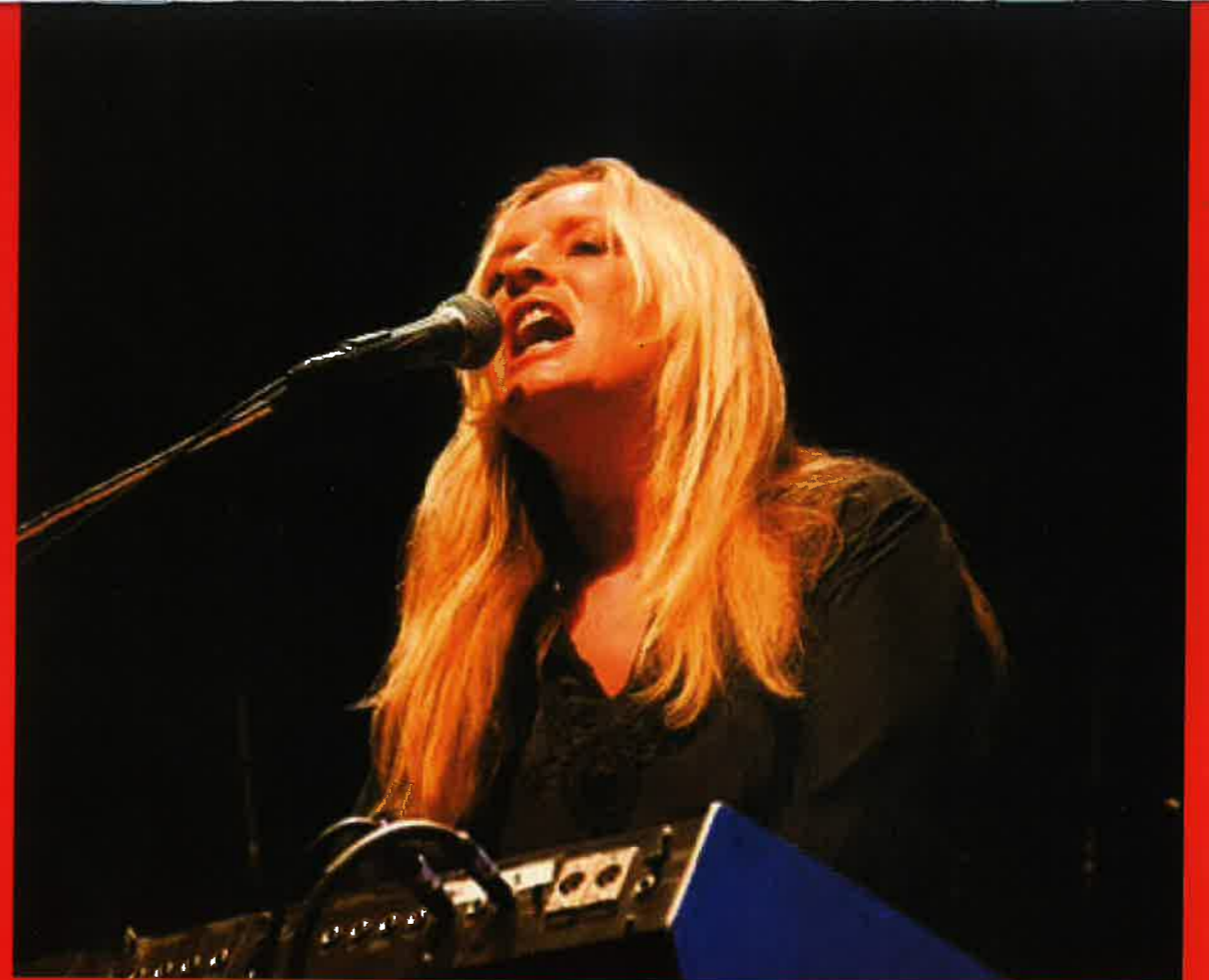
Mynd frá alnótini